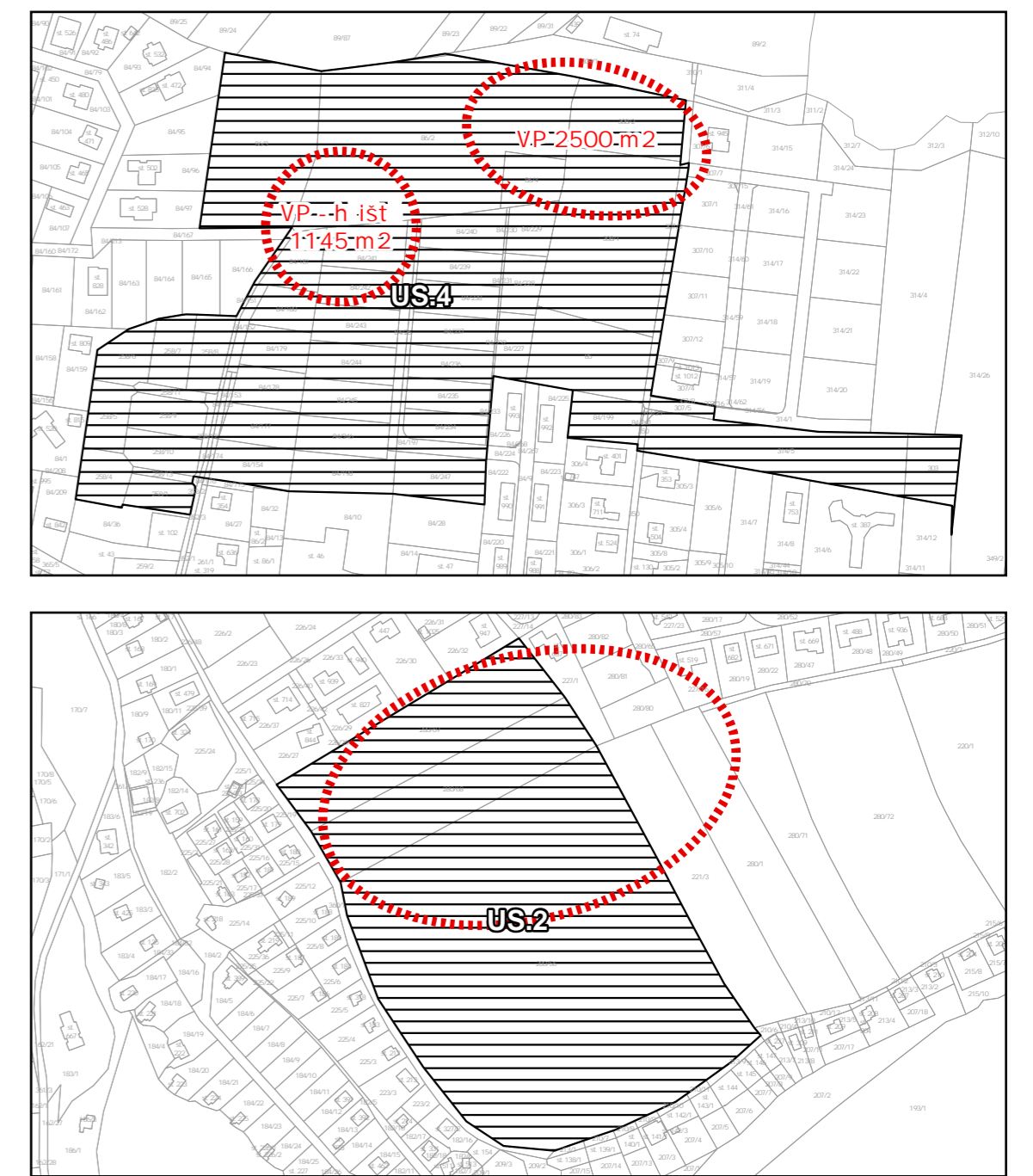
Schéma p ednostního umíst ní ve ejných prostranství / sportu